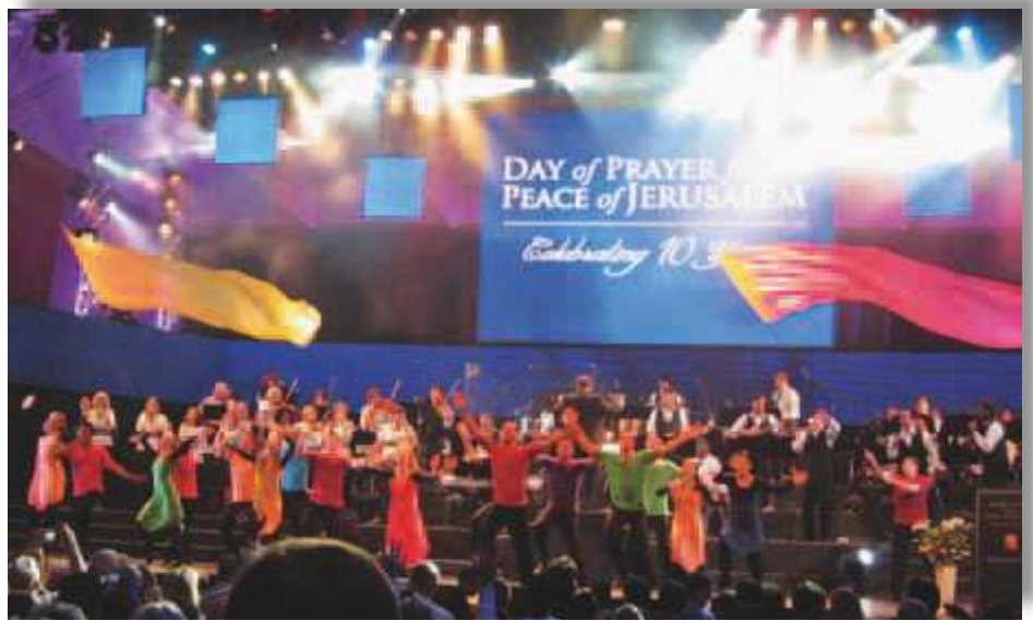
Jerusalemista on tullut kristillisen sionismin suurten ja näyttävien juhlien keskuspaikka.

Raamattu sanoo Jeesuksen palaavan näkyvällä tavalla takaisin maan päälle ja tämän maailman johtajat eivät siitä juuri riemastu. YK:n pääsihteerikään ei tule saamaan siitä erillistä ilmoitusta. Paluun ku-