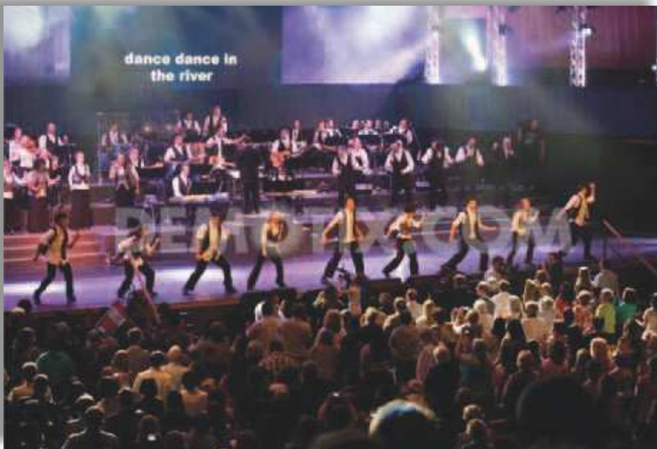
Musiikilla ja tanssilla on suuri merkitys Lehtimajanjuhlissa, kehoitus: tanssi virrassa.

ten Kuningasta” (Sana Jerusalemissa 12/90).