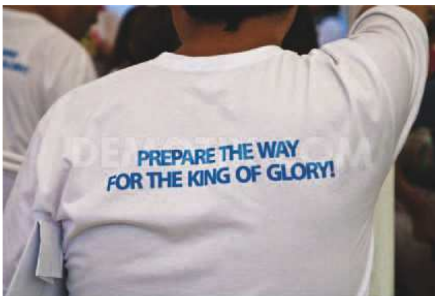
Kristillinen sionismiliike katsoo valmistavansa tietä Herran toiselle tulemukselle.

Monet rabbiinijuutalaisuuden opettajat haluavat vuoropuhelua kristittyjen kanssa. He ovat valmiita korostamaan kristittyjen sosiaalista ja poliittista vastuuta koskien kristityn roolia ajassamme. Heille on sopivaa, että kristillinen toiminta myös ja erityisesti Israelia koskien painottuu sosiaalisen ja poliittisen näkökohdan huomiointiin ohi evankelioimisvastuun. Kristittyjen piirissä monet ovat alkaneet nähdä asioita kuten hekin. ”Daavidin sortuneen majan” pystyttämiseksi, Israelin ”lohduttamiselle” ja ”tien valmistamiselle Herralle” on paljolti muodostunut sosiaalis-poliittinen sisältö.